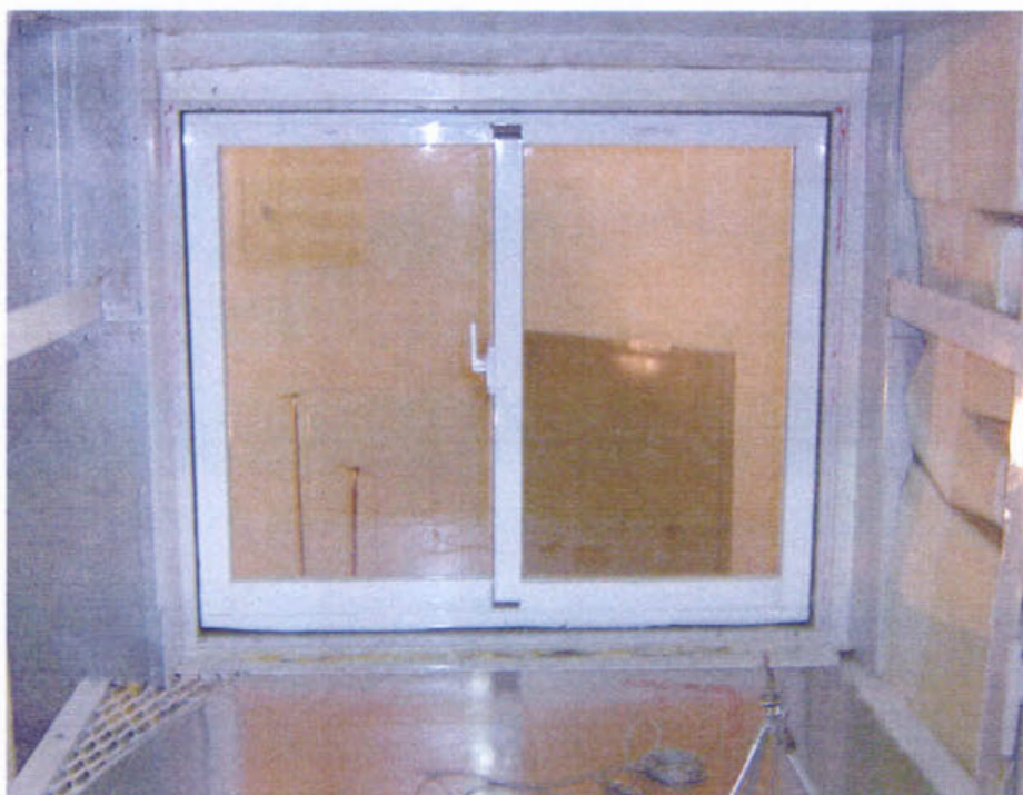
圖 1 試樣佈置圖 (無響室)