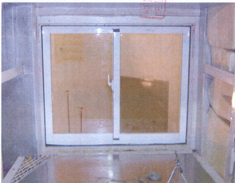
圖 2 試樣佈置圖 (迴響室)